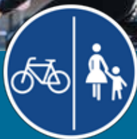
Pistă de bicicletă lângă un trotuar