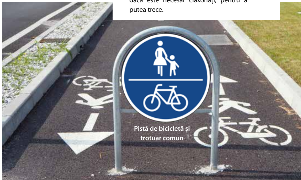
Pistă de bicicletă și trotuar comun

De aceea: Acordați atenție pietonilor și dacă este necesar claxonați, pentru a putea trece.