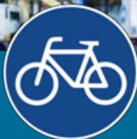
Pistă de biciclete