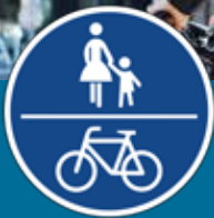
Pistă de bicicletă și trotuar comun