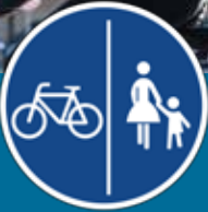
አብ ጥቕ መገዳ ብሽክለታ አብ ጥቕ